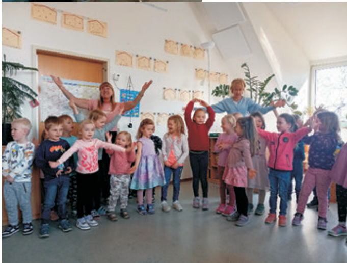
Thomas Reicherzer Erster Bürgermeister

Insgesamt wurden an diesem Tag 1130 Glücksbringer verteilt. So konnte das Glück weit über den Kindergarten hinaus getragen werden und viele Menschen erfreuen.