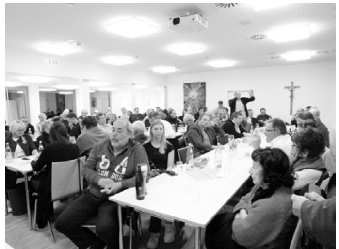
Gespannte Aufmerksamkeit beim politischen Aschermittwoch im Bischof-Sproll-Haus in Nattheim.