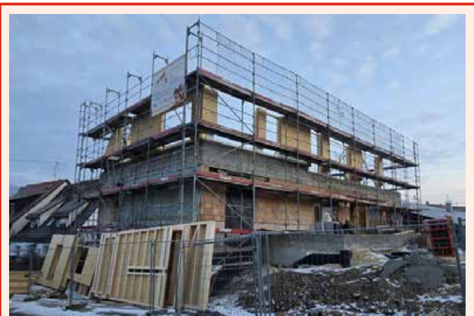
Bei der Sanierung und Erweiterung des Ortschaftsverwaltungsgebäudes in Fleinheim hat die Montage des 2. OG begonnen.