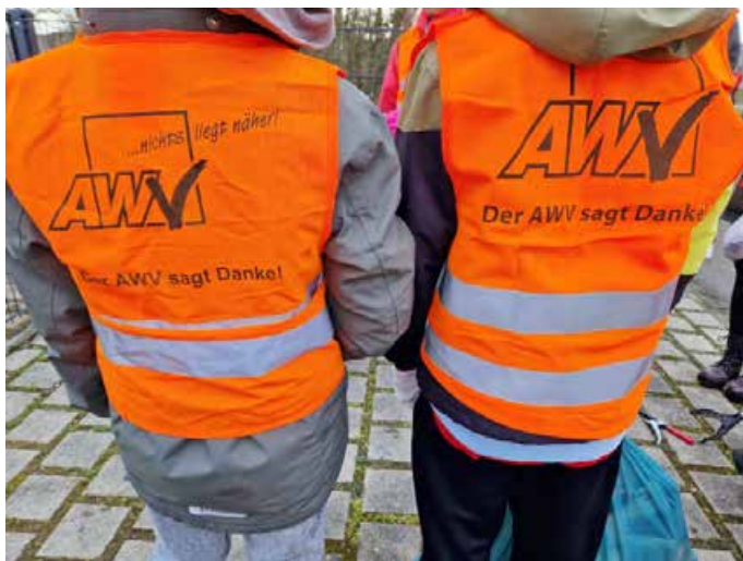
Für eine saubere Umwelt sammelten die Schüler auch heuer fleißig wilden Müll.

Die fleißigen Schüler sammelten auf jeden Fall jede Menge Säcke mit Müll und Abfall. Ausgestattet mit Warnwesten, Schutzhandschuhen und einigen Müllsäcken durchstreiften sie das Gemeindegebiet und befreiten es von achtlos weggeworfenem Unrat. Über die kleine Stärkung, die der AWW im Nachhinein zur Verfügung stellte, freuten sie sich sehr.