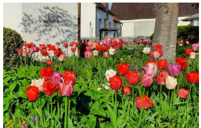
Frühlingszauber: Schon bald ziert ein blühendes Tulpenmeer wieder unser Dorfbild.