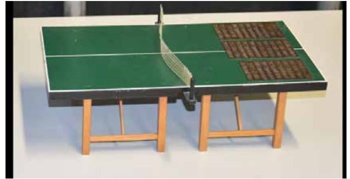
Die TT-Hobbymeisterschaften finden heuer am 25. April statt. Die Siegestrophäe: der Wanderpokal - ein selbst erbauter TT-Tisch mit allen Gewinnern der letzten Jahre.

https://tischtennis-mertingen.de/aktuelles