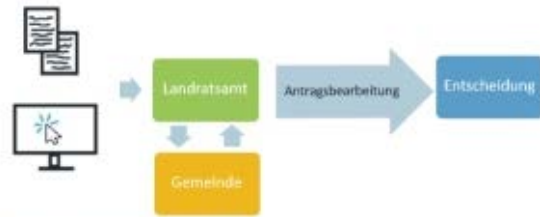
Abbildung 2: Verfahrensablauf ab 01.01.2025