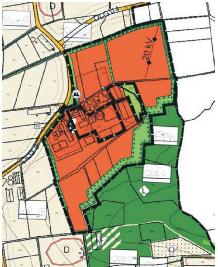
Ausschnitt Entwurf 2. Änderung des Flächennutzungsplans mit Landschaftsplan vom 10.10.2024, unmaßstäblich, genordet

Der Planbereich ist im folgenden Kartenausschnitt dargestellt.