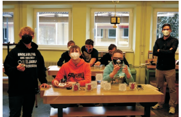
Erfolgserlebnis: Die Neuntklässler und ihr Klassenlehrer freuen sich über die fertiggestellten CO2-Ampeln