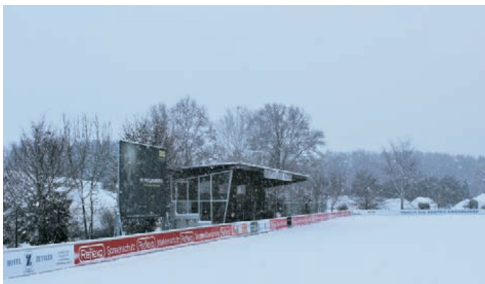
Der erste Schnee bedeckt die Anlagen im gesperrten Hans Peter Albrecht-Sportpark.

Danke für ihr Verständnis, bleiben Sie und ihre Familien gesund!