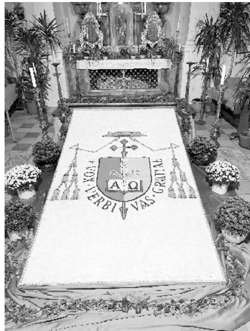
Text und Fotos: Johannes Lohner