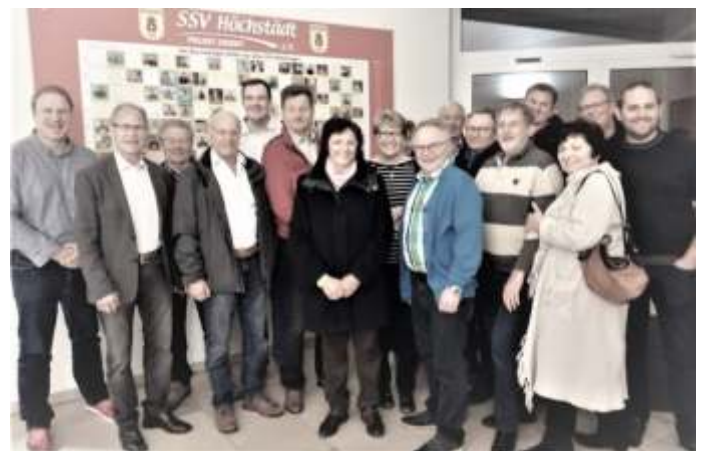
Vorstand, 3. Bgm., Stadträte und Mitglieder der FW vor Ort bei der SSV