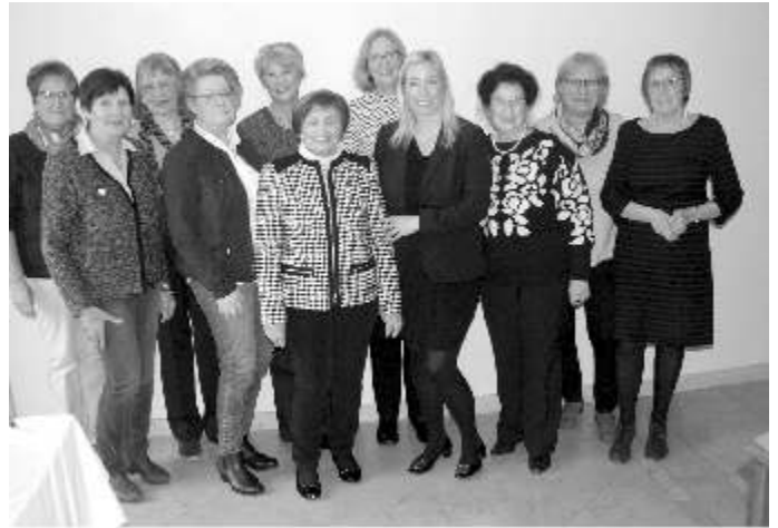
Die neue Vorstandschaft des Kneipp-Vereins Gundelfingen