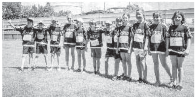
Die Offinger Athleten in den neuen Trikots

Betreuer und Eltern waren mit den Leistungen der Athleten und dem Modus des Wettkampfes mehr als zufrieden. Stolz wurden an diesem Wettkampf die neuen Trikots der Abteilung von Sponsor Kögl-Flexmo präsentiert und gleich mit einem Sieg eingeweiht.