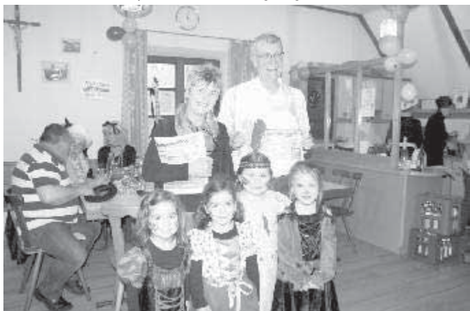
gumpiger Donnerstag im Pfarrstadel

und aufmerksam um das Wohl der Gäste kümmerten, sorgten mit selbstgebackenen Kuchen, ausreichend Kaffee und Getränken für das leibliche Wohl. Herzlichen Dank an alle, die zum Gelingen und Danke an alle, die durch ihr Erscheinen zu entspannten Stunden beigetragen haben.