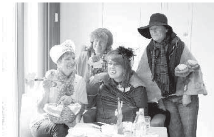
rußiger Freitag im Pfarrheim