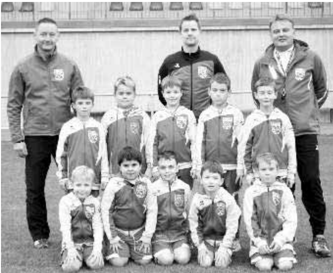
(F-Jugend SG Gundremmingen)