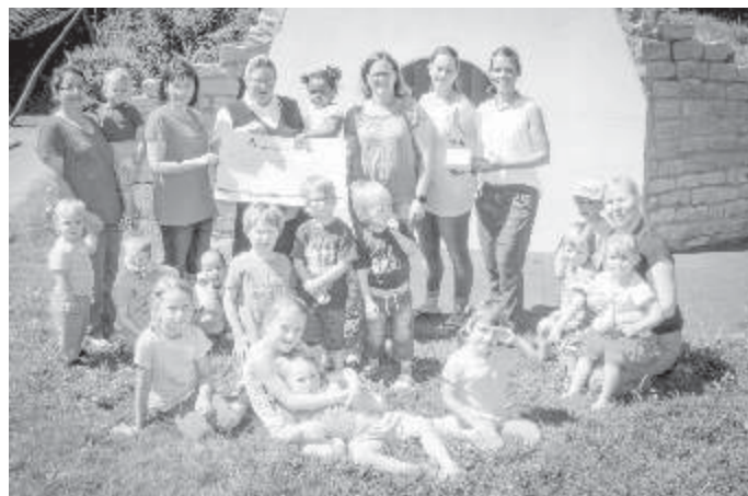
Übergabe des Spendengeldes im Kinderheim St. Clara in Gundelfingen