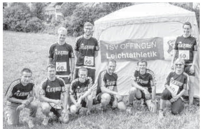
Die Offinger vor dem neuen Teampavillon