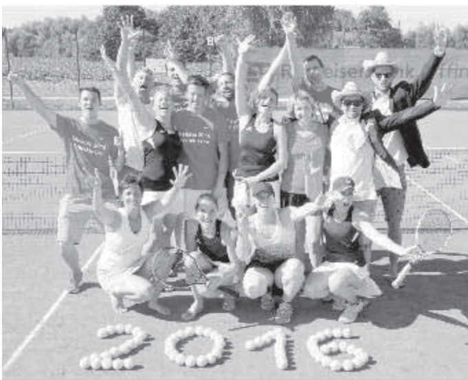
Die Damen 1 und die Herren 2 des TSV Offingen freuen sich gemeinsam über ihre Meisterschaften.