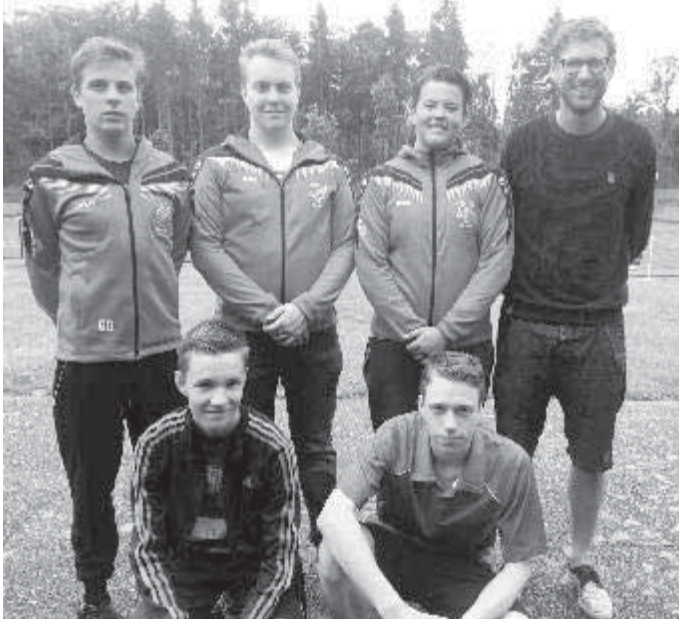
Die Junioren konnten das Derby gegen den FC Gundelfingen klar mit 14:0 für sich entscheiden.

FC Burlafingen - Bambini 3:11 (Punkte durch Jan-Luca Motzer, Moritz Schwarz, Simon Müller, Lukas Hauptelthofer und Motzer/Schwarz)