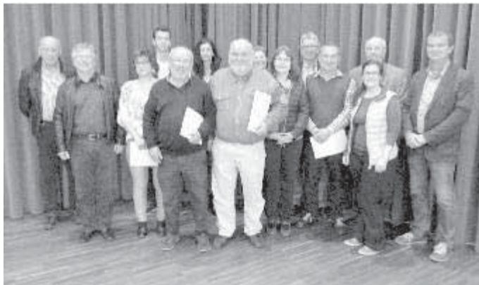
Die Vorstandschaft der SpVgg Gundremmingen

Mitglied seit 1978, Jugendtrainer von 1982-1988, Jugendleiter von 1986-1988, Hauptorganisator der 60 Jahrfeier, Schiedsrichter seit 1988-heute (28 Jahre) mit ca. 1200 geleiteten Spielen.