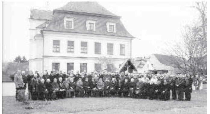
Gruppenbild aller Jahrgangsteilnehmer