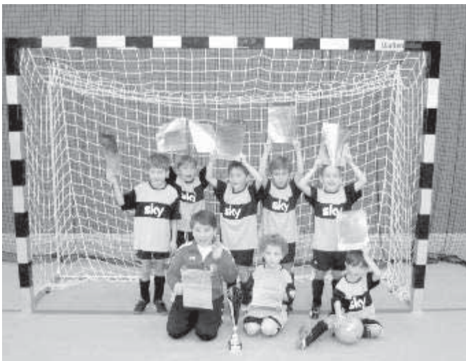
(Der Sieger des G-Jugendturniers, der FC Günzburg)

Am Wochenende fanden die 1. Gundremminger Hallentage statt.