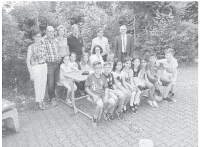
Bild: Grund- und Mittelschule

Für die Schüler der Grund- und Mittelschule Höchstädt konnte nun das Freizeitangebot erweitert werden. Bisher gab es, besonders für die Kinder der Mittagsbetreuung und der Ganztagsklassen,