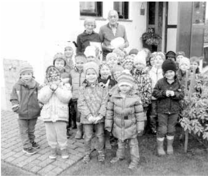
Ulrich Müller Erster Bürgermeister