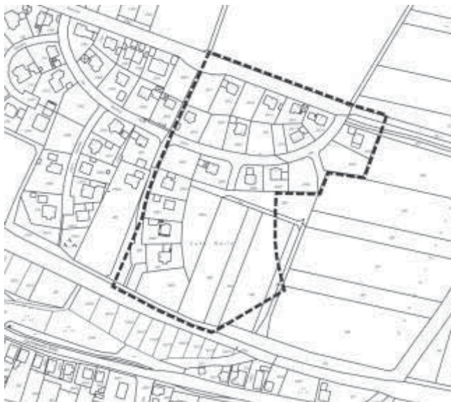
Abbildung 1: nichtmaßstäblicher Ausschnitt des Geltungsbereiches zur 1. vereinfachten Änderung des Bebauungsplanes mit Grünordnung „Am Wiesenberg III“

Während der Auslegungsfrist können Stellungnahmen abgegeben werden. Gemäß § 3 Abs. 2 BauGB wird darauf hingewiesen, dass nicht fristgerecht abgegebene Stellungnahmen bei der Beschlussfassung über den Bebauungsplan unberücksichtigt bleiben können und dass ein Antrag nach § 47 Verwaltungsgerichtsordnung (VwGO) unzulässig ist, soweit mit ihm Einwendungen geltend gemacht werden, die vom Antragsteller im Rahmen der Auslegung nicht oder verspätet geltend gemacht wurden, aber hätten geltend gemacht werden können.