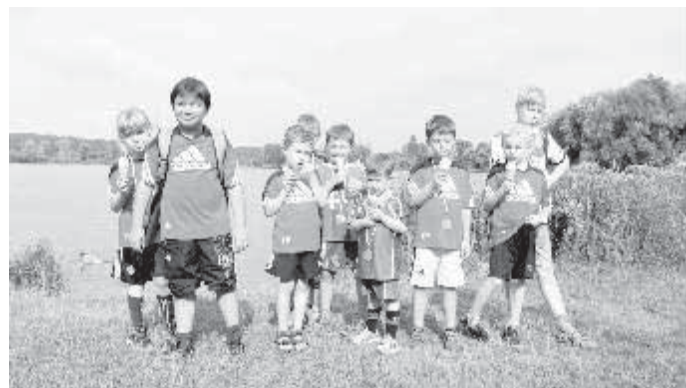
Belohnung am Silbersee

Das letzte Spiel ging leider denkbar knapp mit 0:1 gegen Hochwang verloren. Somit konnte ein respektabler 6. Platz erreicht werden. Dies wurde anschließend mit Eis und einem Badestopp am Silbersee gefeiert.