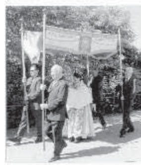
Fronleichnam 2015 Historische Hausaltare in Rettenbach Preis pro Stück 35,00 Euro

unser Rettenbacher Mitbürger, Herr Willibald Lang, hat ein Fotobuch "Fronleichnam 2015" - Historische Hausaltare in Rettenbach erstellt. Das Fotobuch ist 21cmx28cm groß, hat 26 Seiten und alle Fotos sind auf Fotopapier gedruckt. Der Preis pro Stück beträgt 35,00 Euro. Ihre Bestellung nimmt Herr Willibald Lang unter Tel:08224/7461 entgegen. Letzter Bestelltermin ist Freitag, der 11. September 2015. Danach ist keine Bestellung mehr möglich, da die Vorlagen gelöscht werden.