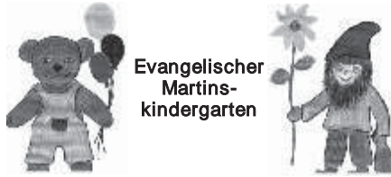
Evangelischer Martins- Kindergarten