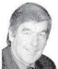
22 Schön Norbert 1. Bürgermeister Zöschlingen