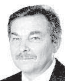
13 Schilling Reinhold 1. Bürgermeister Schwenningen