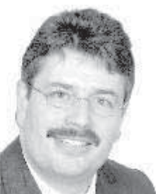
23 Ott Dieter 1. Bürgermeister Haunsheim