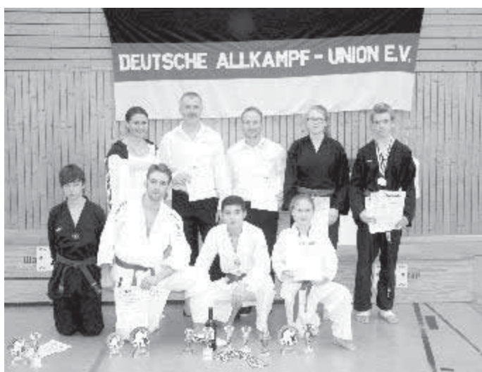
Auf dem Foto die Erfolgreiche Mannschaft aus Rettenbach und der Sportschule Kinzel.