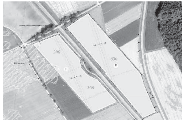
Flst.Nr. 382, Gemarkung Schnuttenbach (Externe Ausgleichsfläche):

Externe Ausgleichsfläche Fl.Nr. 382, Gemarkung Schnuttenbach M 1:2.000