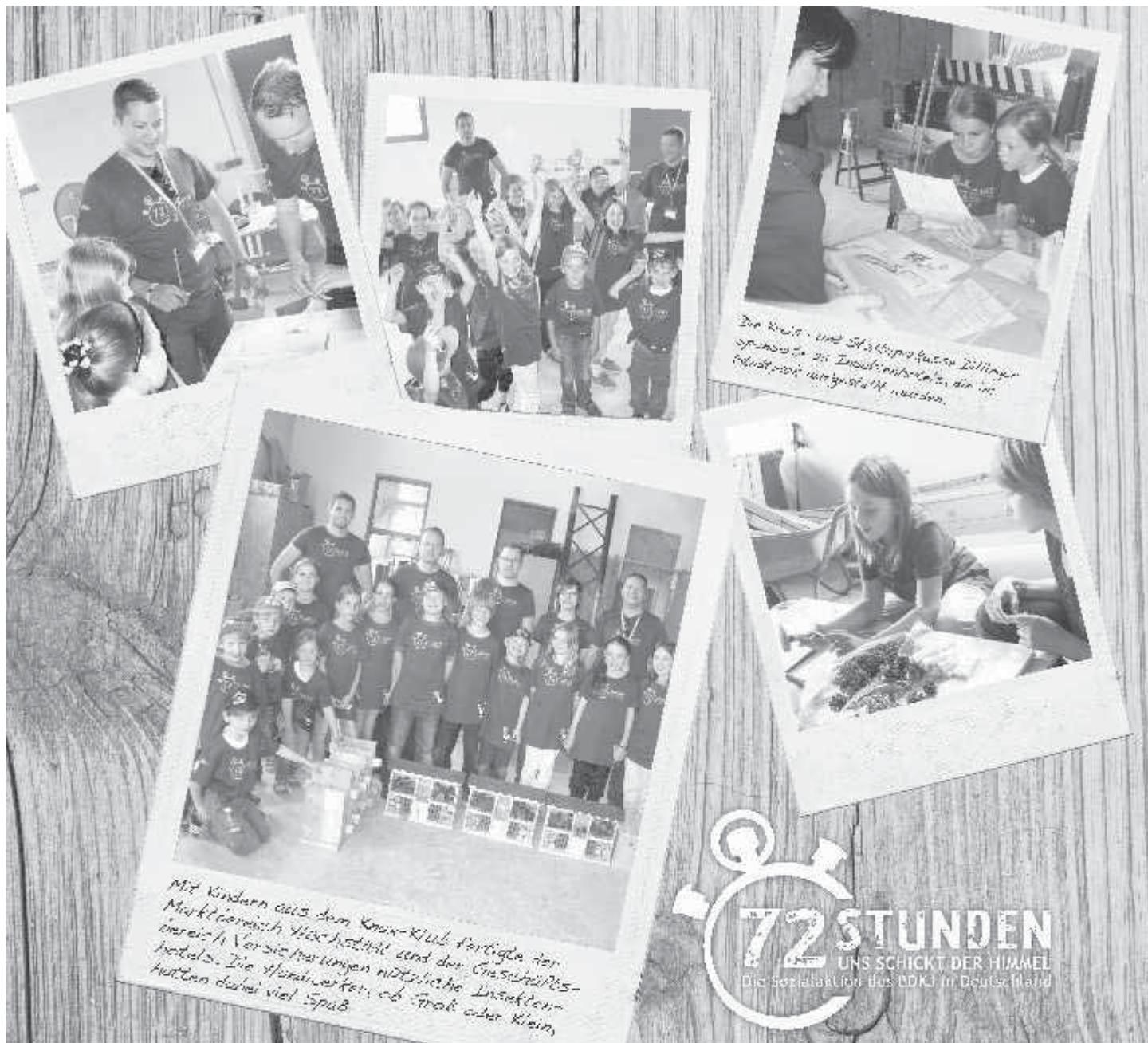
Der Kreis- und Stadtsparkasse Dillinger sponsorierte die Insektenarbeiten, die im Inhalt nicht weiter gezeigt wurden.