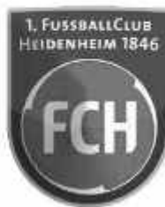
1. FC Heidenheim 1846

Die Fa. WeReTEC GmbH sucht ab sofort für ihre Büro- und Werkstatträume eine zuverlässige