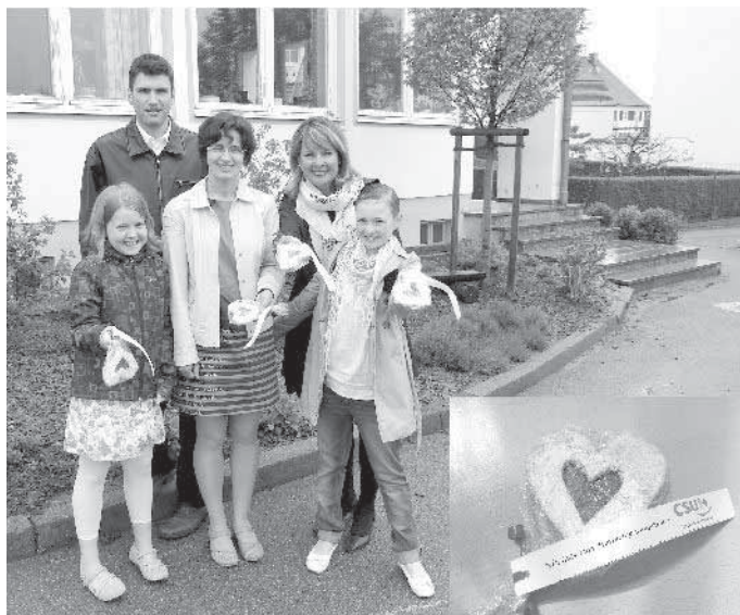
Auf dem Foto fehlen: Rudolf Geißler und Werner Brenner

Mit "Flammenden Herzen" haben einige Mitglieder des CSU-Ortsverbandes Rettenbach am Muttertag den Müttern eine Freude bereitet. Gleich im Anschluss an den Sonntagsgottesdienst wurden die Mütter und Omas mit der süßen Aufmerksamkeit überrascht. Bei dem am Sonntag regnerisch herrschenden Wetter gab es viele fröhliche Gesichter bei den Beschenken. Die Aktion wurde von der neuen Vorstandschaft des Ortsverbandes eingeführt und traditionsgemäß fortgeführt.