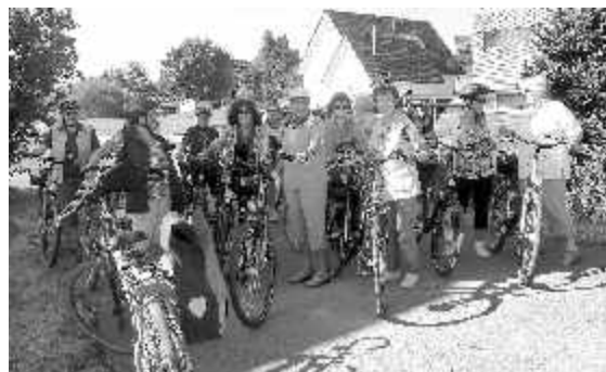
Bei bestem Radwetter genossen wir die Radtour nach Günzburg

Liebe Seniorinnen und Senioren, die Seniorenbegegnungsstätte im Klaiberhaus ist wieder für Sie geöffnet.