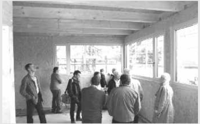
Mehrere Gemeinderäte im neuen Sozialraum