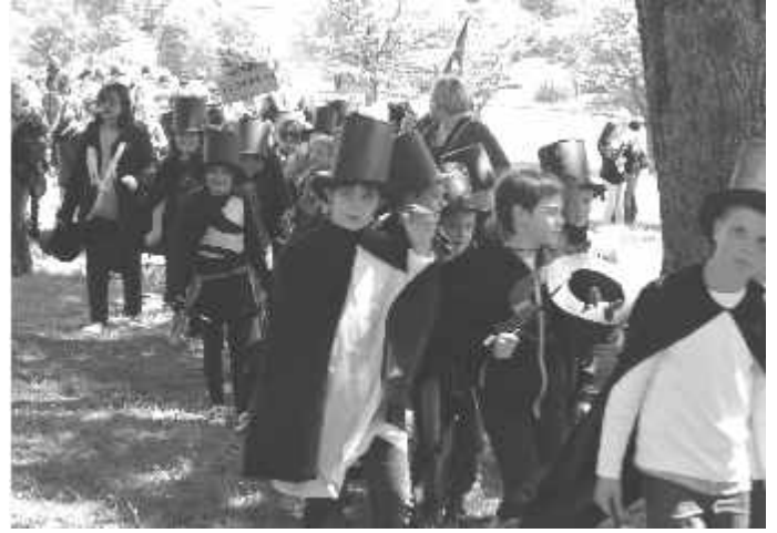
Die Zauberer der Klasse 4 beim Festumzug

Zum Rest des Nachmittags waren Spaß, Spiel und Spannung angesagt. Während sich die Älteren bei Speis und Trank auf den Bänken unter den Bäumen niederließen, sorgten die beiden Musikvereine für die musikalische Unterhaltung. Die Kinder begeisterten sich allerdings mehr für Ponyreiten, Karussellfahren, Kletterbaum oder Trampolin-Bungee. Trotz zweier kurzer Regengüsse konnten die Festbesucher noch einige schöne Stunden auf dem Kinderfestplatz genießen. (hz)