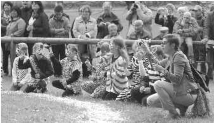
Die Zweit- und Drittklässler auf Safari