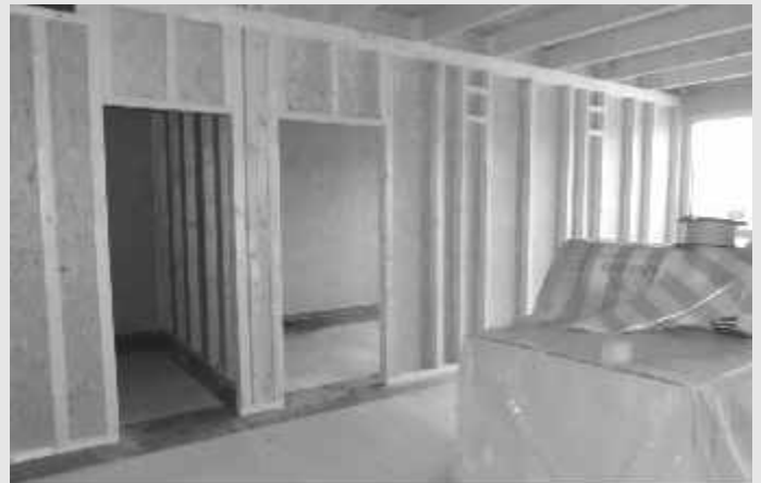
Der neue Krippenbereich im Entstehen