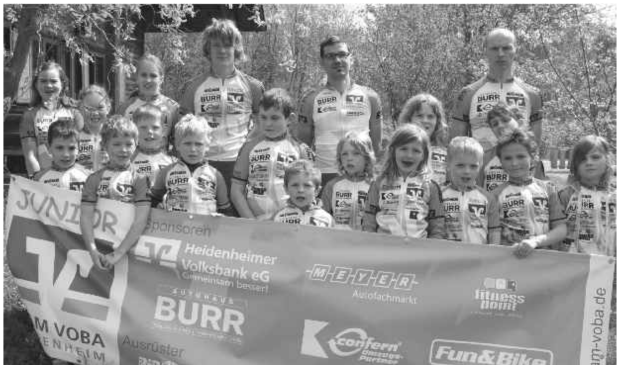
Bild unten: Die Teilnehmer des Trainingscamps mit ihren Betreuern – Text siehe nächste Seite.