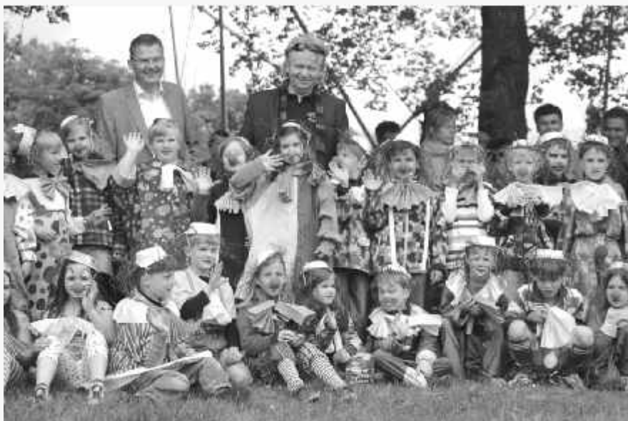
Die Klassen 1 a und 1 b verkleidet als Clowns mit Bundestagsabgeordneten Roderich Kiesewetter und Bürgermeister Norbert Bereska